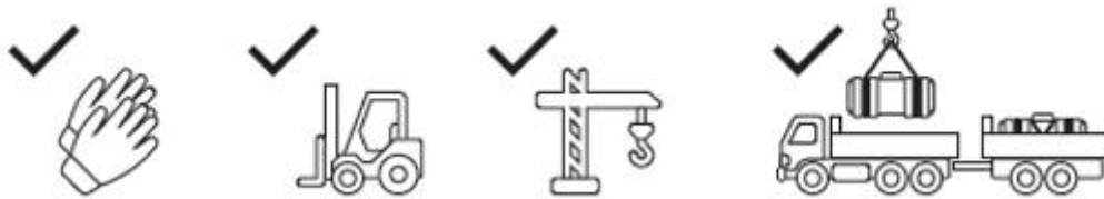
Рис.1 – Схематичне зображення завантаження/розвантаження ємності.

Завантаження та розвантаження виробу в залежності від його габаритів та типу може проводитися як ручним, так і механізованим способом (кран, маніпулятор, навантажувач). Перед завантаженням слід переконатися, що ємність порожня. При механізованому способі завантаження-розвантаження слід застосовувати стропа текстильні стрічкові. Стропа канатні або ланцюгові допускається застосовувати при наявності у ємності спеціальних «вушок». Дотримання цих правил дозволить уникнути деформації ємності та утворення тріщин або зламів в стінці ємності. При транспортуванні виробу слід уникати ударів та механічних пошкоджень.